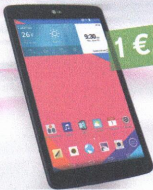
TABLET LG G PAD 8.0 LTE

Predĺžte si zmluvu s paušalom Happy Profi a novým akčiovým tabletom. 4G smartfón od nás dostanete ako darček. Zistite viac na www.telekom.sk