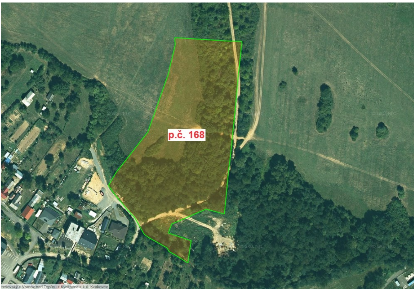
Poloha a tvar pozemku v obci Kvakovce